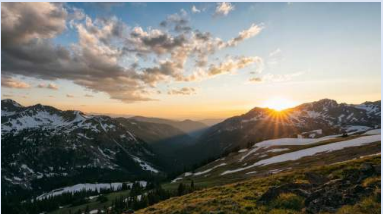
卡里馬巴德鷹巢 Eagle nest