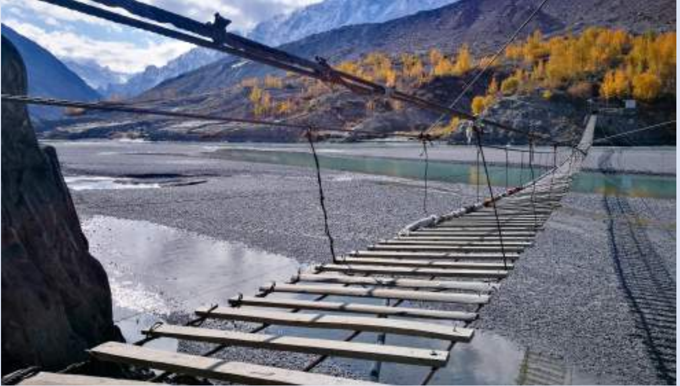
侯賽尼村吊橋 Hussaini Suspension Bridge

喀拉崑崙山區宛如香格里拉，聞名遐邇的鷹巢，您將會欣賞到金黃雪山日出；帕蘇冰河是巴基斯坦最長的冰河；阿塔巴德湖翠綠令人難忘；國家地理頻道稱全世界最危險吊橋，壯麗喀拉崑崙山在您眼前顯現。