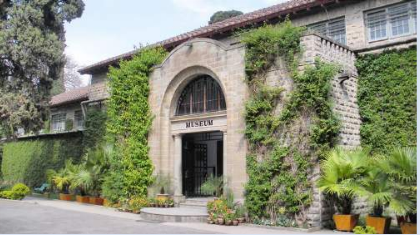
塔克西拉 Taxila Museum