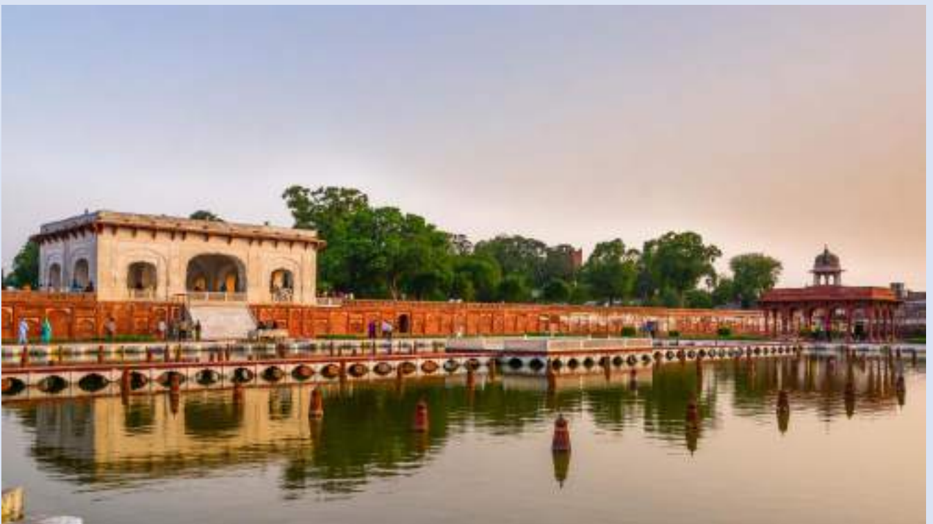
沙利馬爾花園 Shalimar Gardens