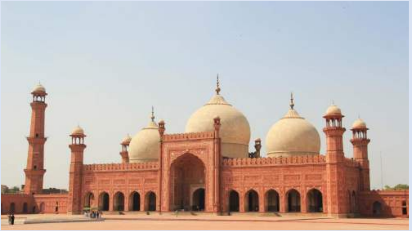
巴德夏希清真寺 Badshahi Mosque