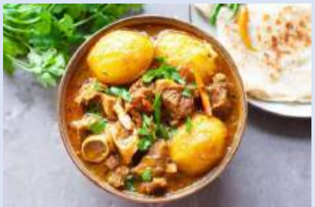
馬鈴薯燴羊肉 Aloo Gosht

羊肉、土豆和番茄，並使用瑪薩拉料、肉桂、香葉、小豆蔻、姜和洋蔥調味，通常搭配著米飯和烤餅一同食用，是最能代表巴基斯坦飲食風味的菜品。