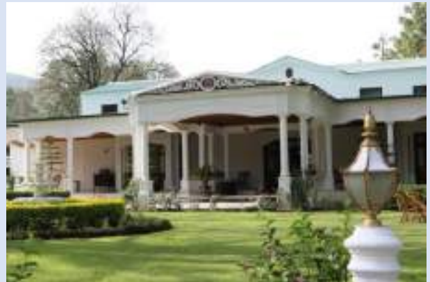
Swat Serena Hotel