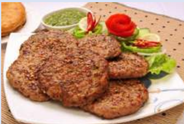
Peshawari Chappli 烤羊肉串