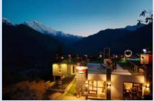
Hard Rock Hotel