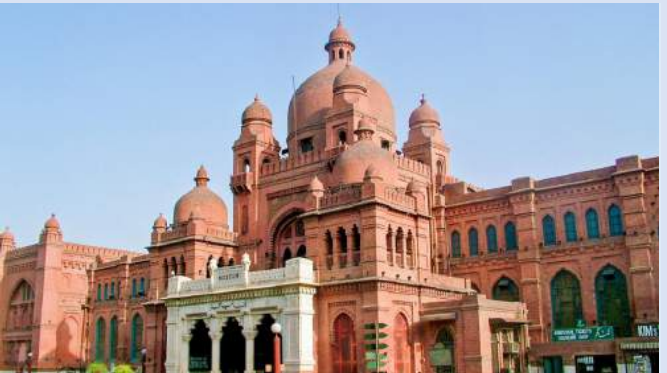
拉合爾博物館 Lahore Museum