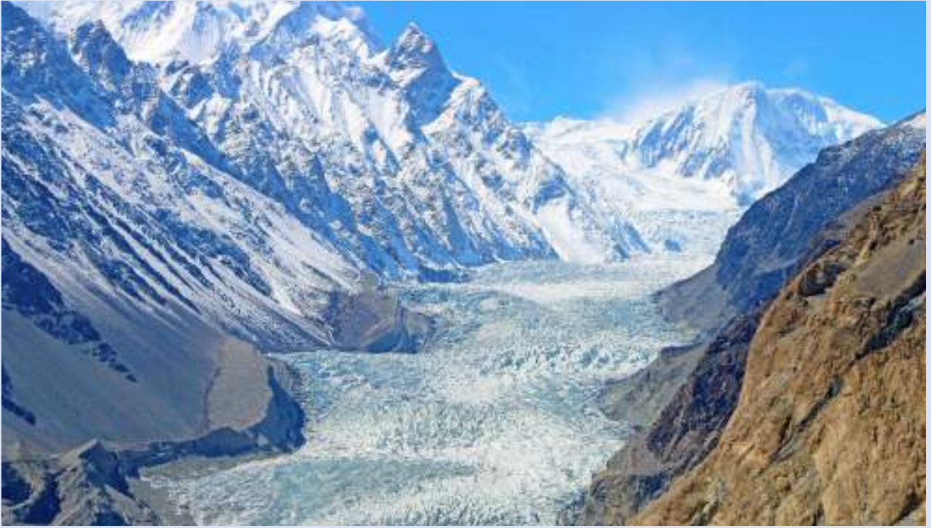
帕蘇冰河 Pasu Glacier