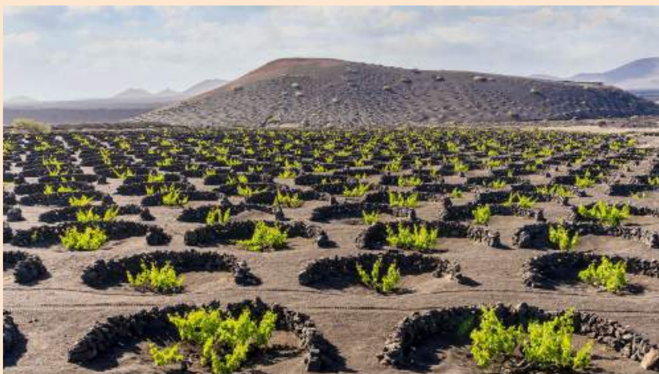
解鎖加納利葡萄酒之謎