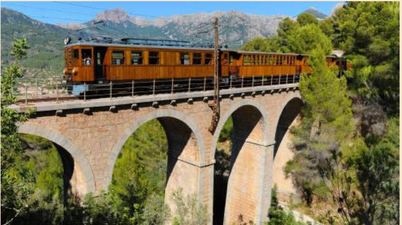
索列爾山谷復古列車